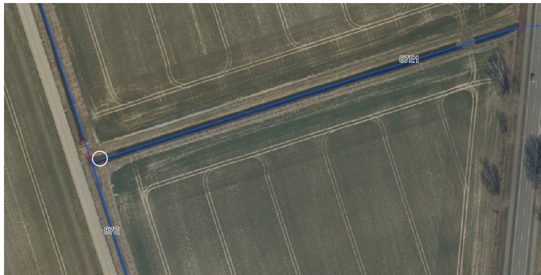
Figur 2 Kort med den ønskede placering af overkørsel, ved station 777 (hvide cirkel).

Ifølge regulativet har der førhen været en rørlægning ved station 777 med en diameter på Ø 600 mm. Derfor vil kravet til rørets diameter være derefter. Vandløbets bundbredden er ifølge regulativet 60 cm.