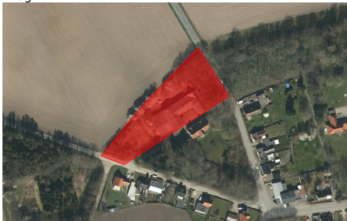
Det ansøgte areal er markeret med rødt.