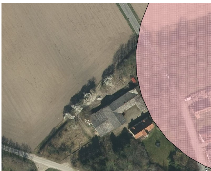
Beskyttelseslinjen – Fredede fortidsminder er vist med lysrød markering.