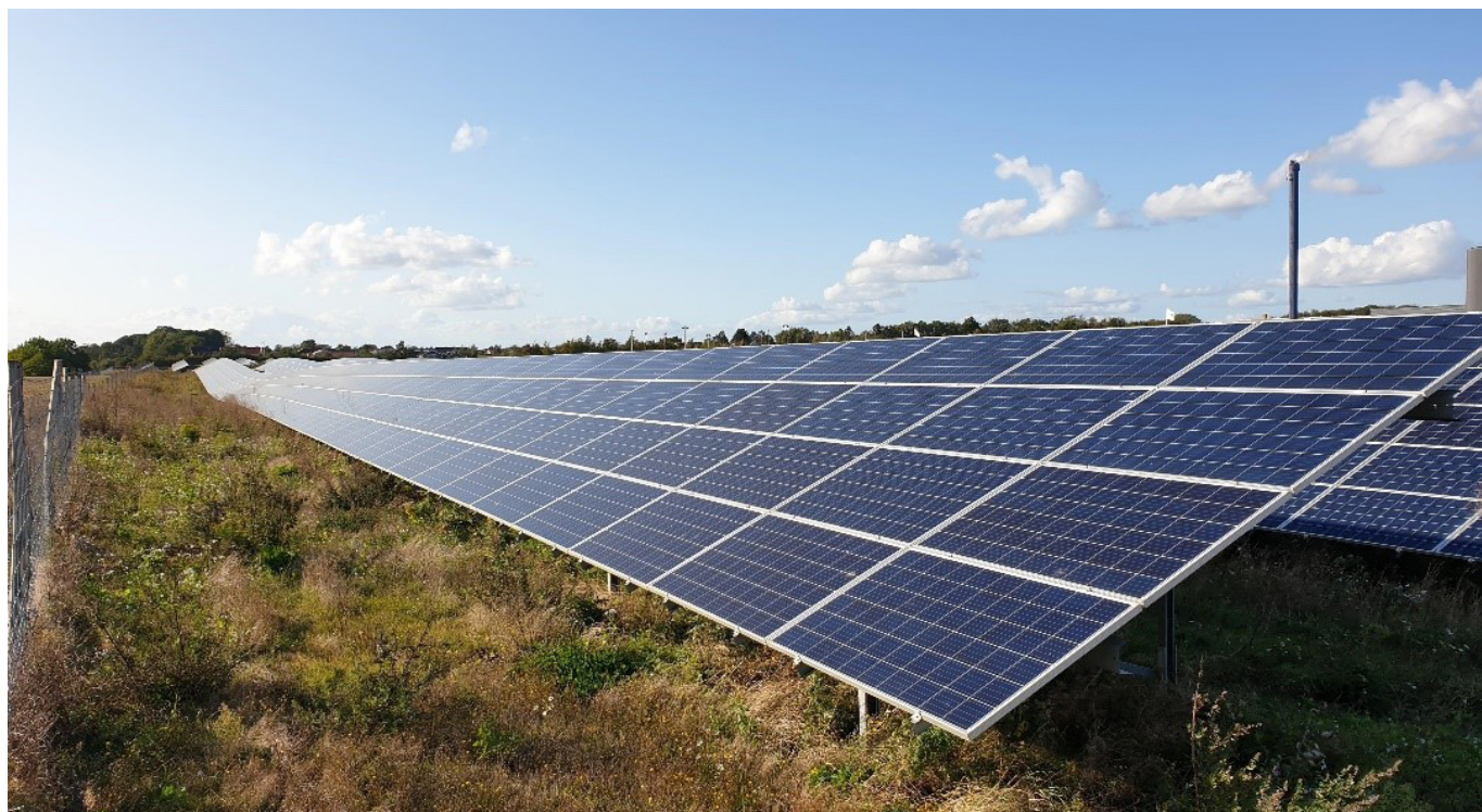
SOLCELLER I GULDBORGSUND KOMMUNE